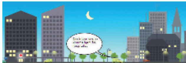
Fra E-learningmodulet: Observation af fysiske symptomer.

Observation af fysiske symptomer kan være med til at forebygge unødvendige indlæggelser af mennesker med demens. Svarer du rigtigt, kan den ældre blive længere i eget hjem. Svarer du derimod forkert, ender personen som patient på hospitalet.